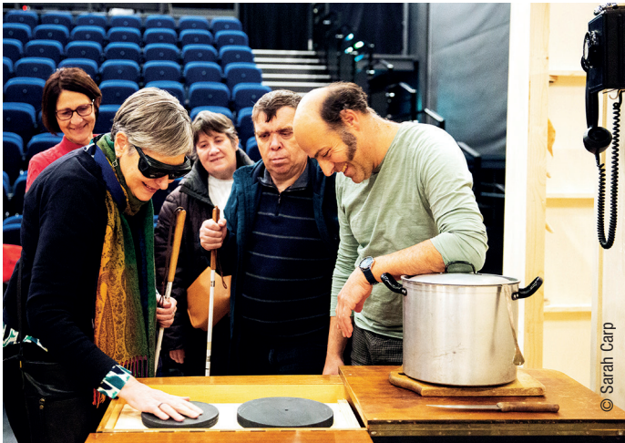
La Règle du jeu